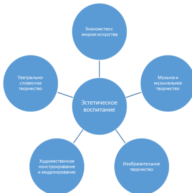
Схема «Эстетическое воспитание»