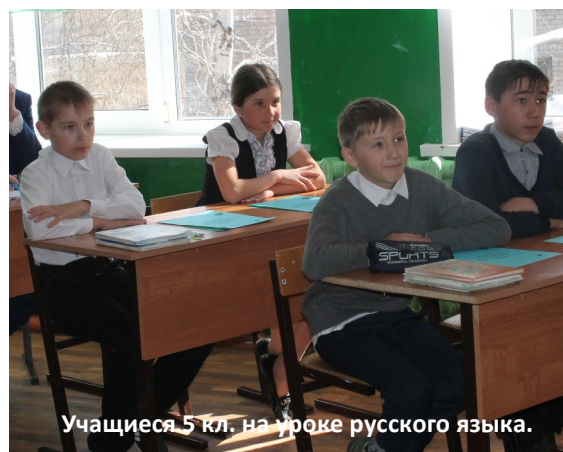
Учащиеся 5 кл. на уроке русского языка.

Уровневая дифференциация способствует более прочному и глубокому усвоению знаний, развитию индивидуальных способностей, развитию